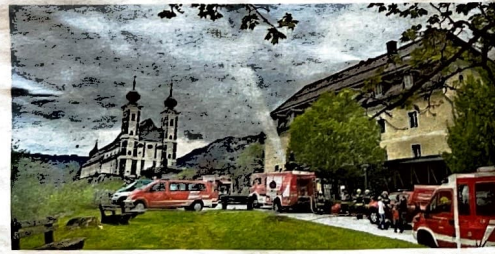
Ein Zimmerbrand im Pflegewohnhaus Frauenberg: Das war die Übungsannahme für die Feuerwehren.

Ein Brandmeldealarm, durch einen Zimmerbrand ausgelöst – das war die Übungsannahme einer Großübung, die von den Feuerwehren Frauenberg, Ardnig und Hall beim Caritas-Pflegewohnhaus Frauenberg erfolgreich gemeistert wurde. Vorrangiges Ziel dieser Übung war es, die Wasserförderung vom Badeteich Frauenberg über die Zufahrtsstraße auf den Frauenberg zu verlegen. Es wurde eine Zubringerleitung von fast 800 Metern mit einer Höhendifferenz von etwa 80 Metern überwunden.